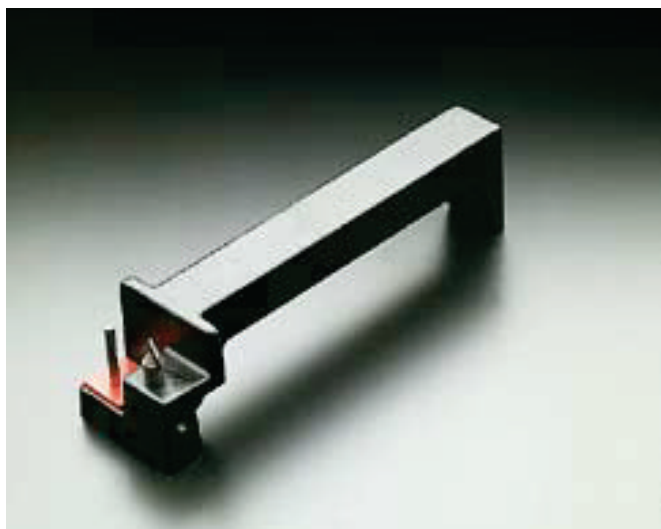
NAGEL-Bohrerschärfer für schnelles Nachschleifen „vor Ort“